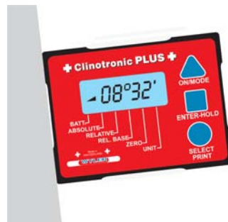
Examples of special option +CLINOTRONIC PLUS+ Beispiele für Spezialausführungen +CLINOTRONIC PLUS+